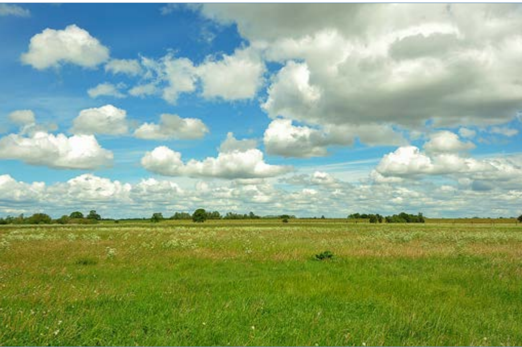
Verheerender Flächenverbrauch: Laut Umweltbundesamt würden nach den jetzigen Plänen des BMVI täglich 2,9 Hektar Landschaft zerstört werden.